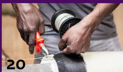
Leren in én na detentie