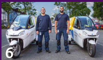
Hulpmonteurs voor één taak