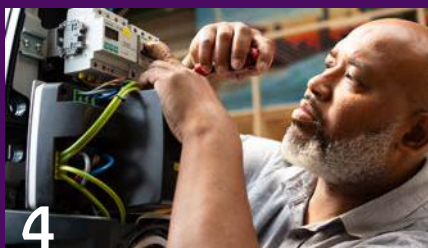
De kracht van de Beroepentuin