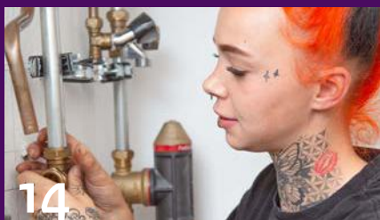
Vrouwen in de techniek